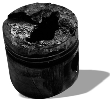
Клапан установили в направляющей втулке почти без зазора. Заклинить он был просто обязан. И разбить поршень тоже.