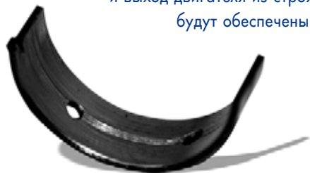
Глубокая борозда в середине вкладыша — типичный результат некачественной мойки или вообще ее отсутствия.