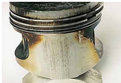
Если зазор между поршнем и цилиндром сделать слишком малым, задиры поршня и выход двигателя из строя будут обеспечены.

Результаты дешевой и быстрой переборки довольно плачевны: придется покупать те же самые запчасти и заново ремонтировать двигатель. В итоге получится, что лучше — и в конечном счете дешевле — сразу доверить ремонт профессионалам. Тем, кто имеет в своем распоряжении весь