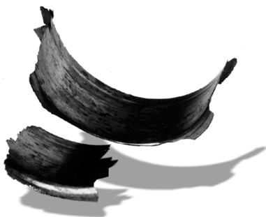
Расплавленный вкладыш — результат неосторожного обращения с герметиком.