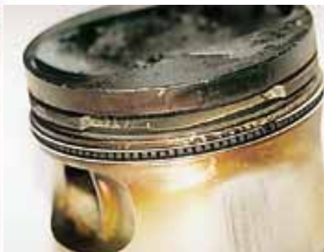
Регулировка опережения зажигания — «мелочь», из-за которой легко сломается перемычка на поршне.