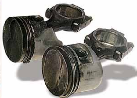
Совершенно разные поршни стояли в одном двигателе. Для чего это сделано, наверное, не расскажет и сам «автор» этого рацпредложения.