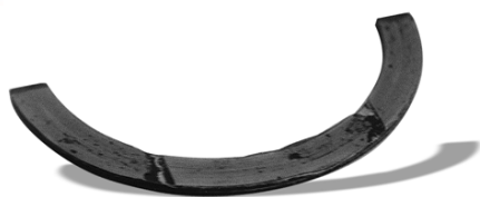
Вместо стандартных полуколец кто-то «забил» ремонтные. Их, естественно, «задрало» вместе с упорными поверхностями на коленвале.