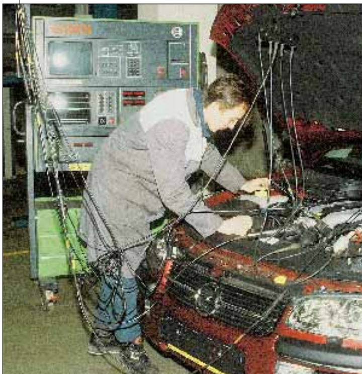
Диагностика поможет найти и устранить неисправности не только иномарок,...