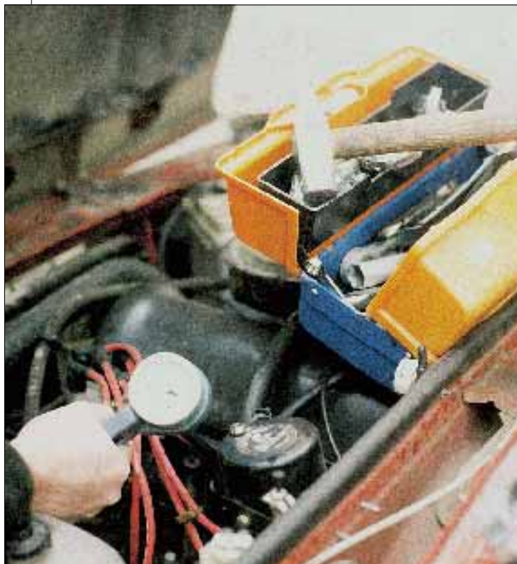
... но и отечественных автомобилей

назвать электронной: она позволяет анализировать электронные системы управления при помощи электронного же диагностического оборудования. Но это не отменяет и не заменяет диагностику механической части двигателя, для которой в арсенале остались традиционные средства.