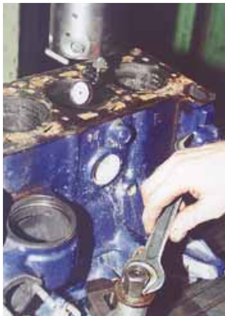
Поставив блок на скалку, необходимо отрегулировать положение блока в поперечном направлении.

по вертикали в двух направлениях — поперечном и продольном. При этом фактически исходят из того, что цилиндр не «косит», т.е. за базу выбирают, в конечном счете, образующую цилиндра.