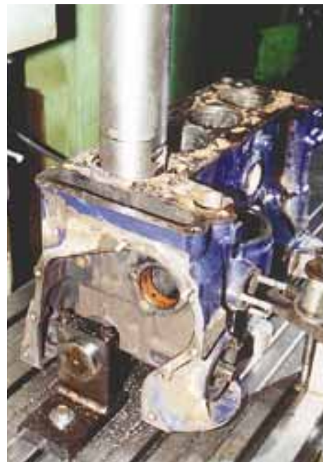
Осталось только расточить блок — качество работы обеспечено правильной технологией.

Где же выход? Да здесь же, под руками. Ведь если нельзя иначе, то почему бы не попробовать растачивать блок непосредственно от постели коленвала?