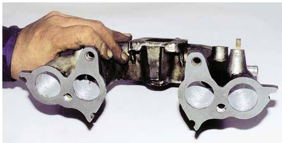
Так выглядит впускной коллектор после доработки.

Настройка карбюраторных систем питания может выполняться разными способами — начиная с подбора проходных сечений жиклеров и кончая