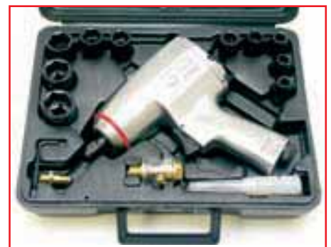
Ударный пневмогайковерт можно приобрести в наборе. В него также входят торцевые головки, штуцер для подсоединения к магистрали, лубрикатор и запас масла.