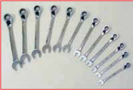
Очень рациональная «комбинация». Рожковой частью ослабляем крепеж, трещоточной — быстро завершаем начатое.

монта. Этим она выгодно отличается от производителей универсального ручного инструмента общепромышленного назначения. Все изделия фирмы отвечают требованиям международных и европейских стандартов. В 1994 году действующая на предприятии система управления качеством продукции сертифицирована на соответствие стандарту ISO 9001. Инструмент обеспечивается бессрочной гарантией на случай выхода из строя по вине производителя (из-за дефекта изготовления или некачественного материала). Что же, это разумнее и, уж точно, честнее безусловной «пожизненной гарантии», которую обещают некоторые фирмы.