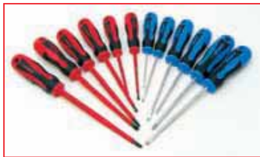
Нарядные отвертки для электриков и механиков. В удобных рукоятках из маслястойкого пластика — отверстия для воротка.

Нам удалось подробно исследовать не более половины каталога. В оставшейся его части — тысячи позиций, включая и отвертки, и разнообразный губцевый инструмент, и инструмент для работы с трубами, и невероятное количество съемников, и многое другое, что найдет применение в автомастерской.