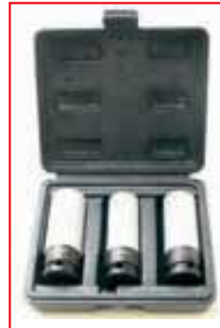
Ударные головки с пластиковым покрытием — незаменимый инструмент для современной шиномонтажной мастерской.

Беглое изучение ее ассортимента убеждает в том, что разработчики имели целью полностью удовлетворить потребности работников автосервисов. Автослесарям не составит труда