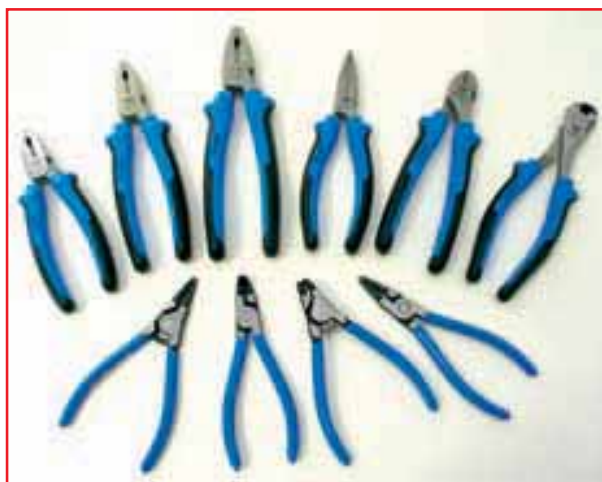
Так же, как и прочая продукция IRIMO, губцевый инструмент отличается большим ассортиментом и отменным исполнением.

В каждой инструментальной группе помимо универсального обязательно присутствует специнструмент, предназначенный для выполнения специфических ремонтных операций на автомобилях определенной марки. Видно, что IRIMO ориентируется на европейских автопроизводителей, французских и немецких.