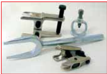
Это лишь малая толика приспособлений IRIMO, предназначенных для обслуживания подвески и рулевого управления.

выбрать подходящие для их работы ударный гайковерт или трещотку, дрель с pistolетной, прямой или угловой рукояткой. Особое внимание привлечет идеальный инструмент для борьбы со всем, что не отворачивается и не отсоединяется — миниатюрная угловая отрезная машинка. При массе 800 г она развивает мощность более 400 Вт, вращая абразивный круг диаметром 75 мм с частотой 20 000 мин -1 !