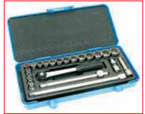
Универсальный набор торцевых головок с аксессуарами в металлическом ящике. Хромованадиевая сталь, оптимальная твердость, безупречные исполнение и отделка.

Вот раздел, который целиком посвящен накидным головкам и всему, что с ними «связано». А связаны с ними: воротки, удлинители, кардан-