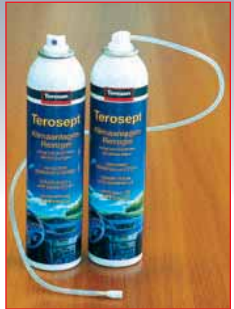
так и в аэрозольных баллончиках для любителей.

ксировать его в этом положении. Отверстие закрыть тряпкой.