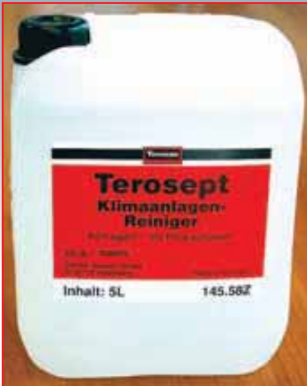
Препарат Terosept поставляется как в канистрах для профессионального использования, ...

можно. Достаточно содержать элементы кондиционера в чистоте. Тем более что это не так уж и сложно при наличии соответствующих материалов и несложного оснащения, которые предлагает компания Teroson, входящая в состав международного химического концерна Henkel.