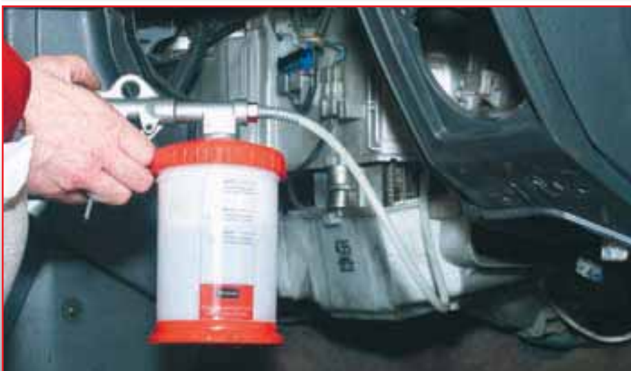
В автосервисных условиях дезинфекция и очистка проводятся с помощью специального пистолета-распылителя.

Приобрести препарат Terosept и получить любую дополнительную информацию можно в ООО «РУСХЕНК» , подразделение Loctite : 115054 Москва, ул. Бахрушина, д. 32, стр. 1. Тел.: (095) 745-23-14. Факс: (095) 745-23-13. www.loctite.ru